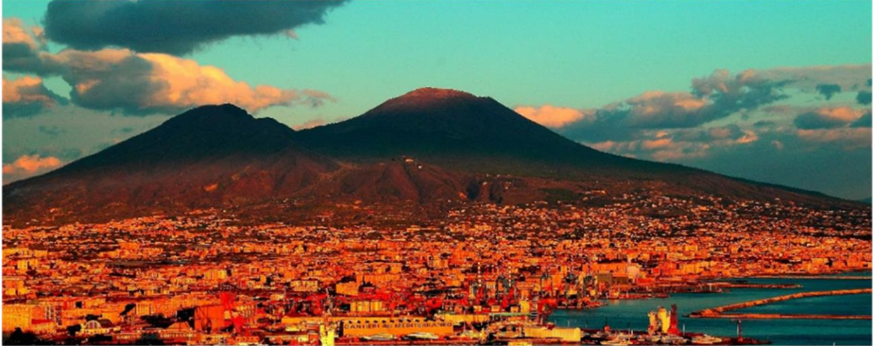
Vesuvius ja Napoli

Tällöin Rastiretki hoitaa ilmoittautumisen kisoihin ja majoitukseen 20.-24.3. Tarvittaessa voimme myös auttaa lentolippujen ja vuokra-autojen kanssa. Suosittelemme tutustumista ainakin Napoliin ja Pompeijiin sekä vaellukseen Vesuviuksen huipulle. Visiitti Roomakin on luonnollisesti yhdistettävissä matkaan.